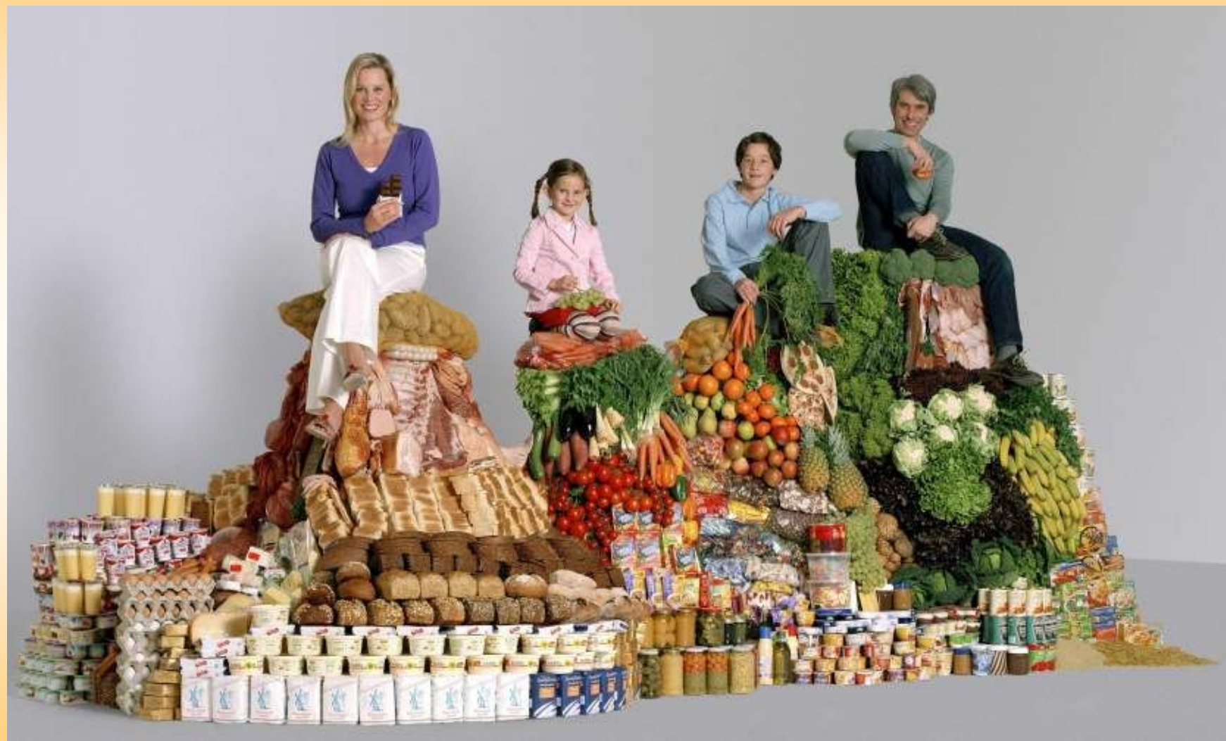
Organic Label Competence Workshop Kiev, 18.05.2010